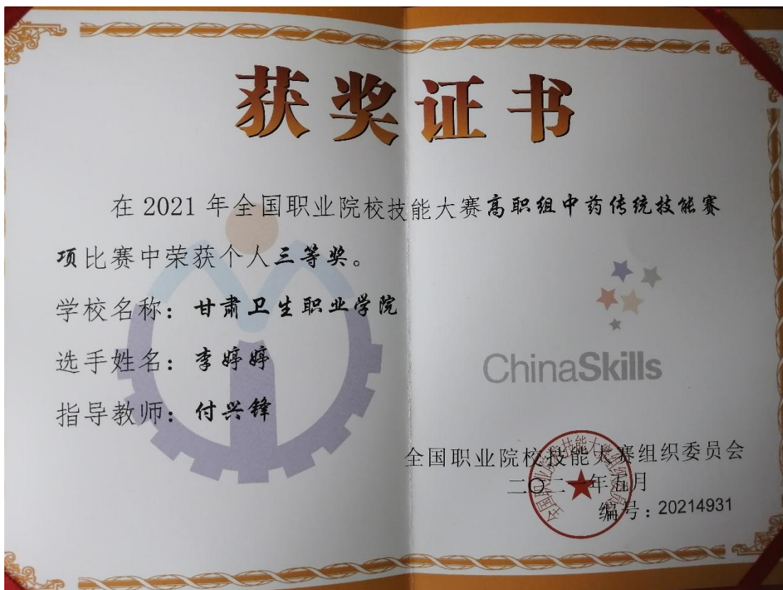
图5 学生在2021年全国职业院校技能大赛中的获奖证书