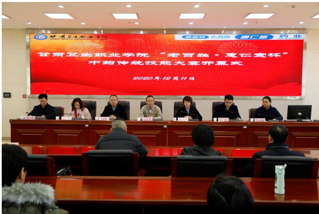
图2 校级“老百姓·惠仁堂杯”中药传统技能大赛开幕式

企业为校本中药传统技能竞赛提供赞助，学校聘请技术娴熟的企业专业技术人员参与制定竞赛规程，并在竞赛中担任竞赛裁判、指导参赛选手，打破了以往只由本校教师担任裁判的惯例，将行业发展前沿带进了传统的技能比赛中，极大提高了比赛的先进性和公正性（图2，图3）。