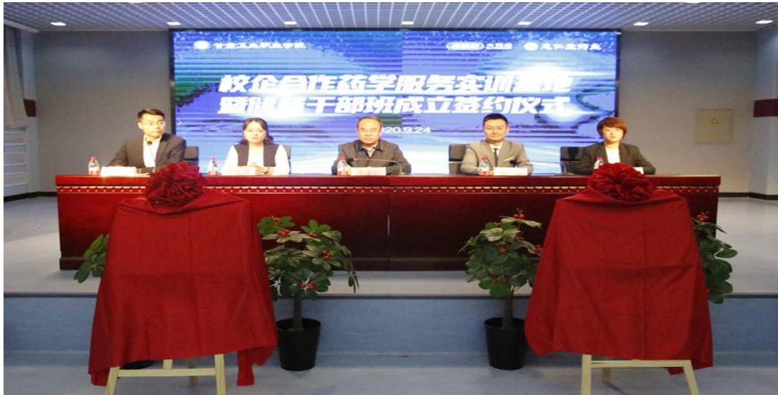
图7 成立“校企共建药学实训基地”暨“老百姓储备干部班”签约仪式