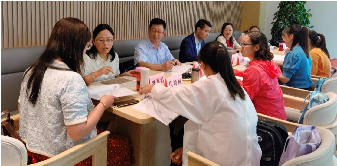
图 8 药学专业群人才培养方案修订研讨

根据药学专业群人才培养目标，校内教师与行业专家共同对本专业群主要职业岗位进行工作任务、岗位能力分析研讨，校企共同构建理论教学与实习训练合一、教学内容与工作岗位合一的一体化专业群课程体系，由公共基础课程、专业基础课程、专业核心及拓展课程等模块组成。