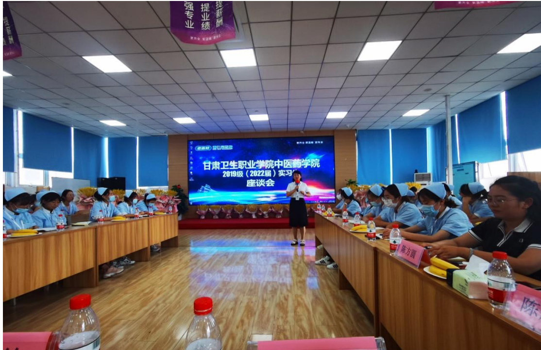
图 1 专业课教师暑假期间与企业代表及实习生座谈