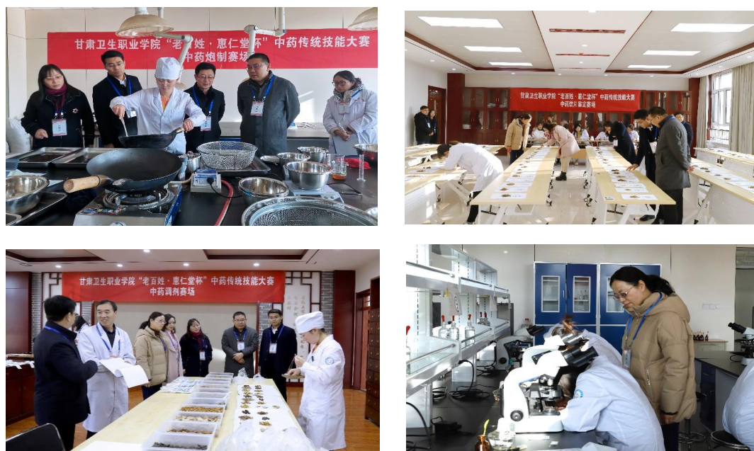
图3 校级“老百姓·惠仁堂杯”中药传统技能大赛比赛现场