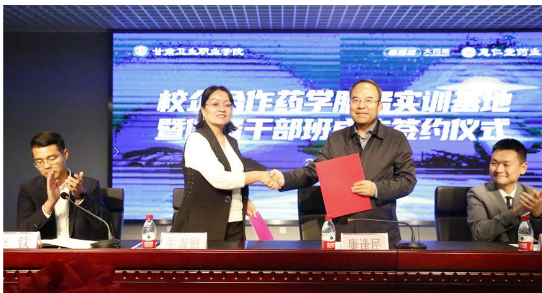
图6 成立“校企共建药学实训基地”暨“老百姓储备干部班”签约仪式

与惠仁堂签约成立“校企共建药学实训基地”暨“老百姓储备干部班”，采取开放办学、“订单式”培养，在教学改革、课程建设、教材开发、实训实习、就业保障等方面开展广泛而深入合作，实现优势互补、利益共享，为学生打造高效的学习平台，切实提高学生的综合能力，进一步增强学校和专业群发展的后劲和活力。首期冠名班选拔的67名学生现已完成顶岗实习并通过企业考核，分配到惠仁堂零售药店、物流配送中心、客服部门、线上门店等，实现优质就业。